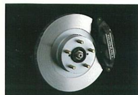
フロント・ベンチレーテッドディスクブレーキ (16インチ対向4ポットキャリパー) (STiバージョン)