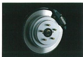
リヤ・ベンチレーテッドディスクブレーキ (15インチ対向2ポットキャリパー) (STiバージョン)