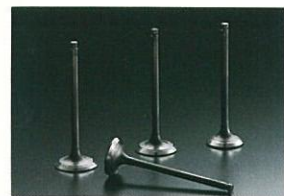
ナトリウム封入中空エキゾーストバルブ

● 4輪倒立式ストラットサスペンション&高剛性ボディ サスペンションは、軽量、低フリクションで、ホイールストロークも十分なストラット式。アルミ製L型フロントロアアームを採用するなど、アームやストラットの軽量化、強度、しなやかな動きなどを細部まで追求している。そして、スバルWRCワークスカーにも搭載する倒立式ストラットをロードバージョンとして採用。ダンパーチューブを上向きに取り付けることで、通常と比べて約3倍の剛性を得ている。またボディ構造の点では、縦置き水平対向エンジンというレイアウトを生かし、頑強なフロントサイドフレームを前席からバンパー前端までほぼストレートに配置。加えて、フロントサスペンションのボディ取り付け位置に、大型クロスメンバーを設置することも可能となり、剛性はより高められている。激しいコーナリングでも、ねじれを極力少なくしてサスペンションの動きをささえる高剛性ボディ。WRXの運動性能を高めるうえで、大きな役割をはたしている。