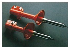
倒立式ストラット・ダンパー