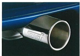
STiロゴ付大口径テールパイプ (STiバージョン)