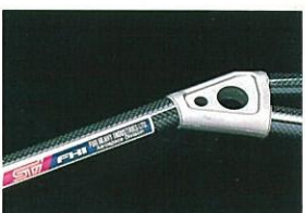
フロント・カーボンストラットタワーバー (STiバージョン)