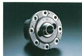
リヤ機械式LSD (STiバージョン)