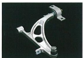
アルミ製フロントロアアーム