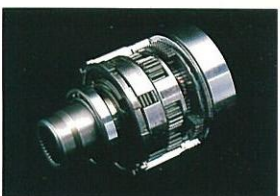
ドライバーズコントロールセンターデフ (STiバージョン)