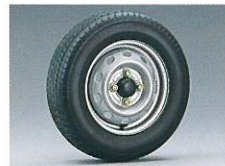
155/70R12ラジアルタイヤ 走行性・耐久性に優れています。