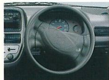
パワーステアリング 軽やかで安定した操作感覚です。