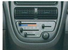
エアコン（エコノモード付） オールシーズン室内を快適に保ちます。