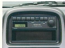
時計機能付電子チューナー AMラジオ ワンタッチ選局のAMラジオです。