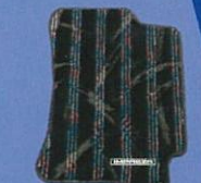
●カーベットマット(ドレッシーライン)セット

■表示価格はメーカー希望小売価格で、取付費¥4,500を含みます。 ■価格には消費税は含まれません。