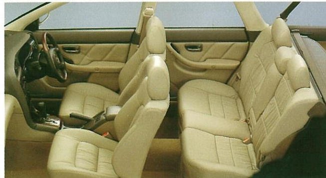
シート地: 本革・ベージュ(メーカー装着オプション・受注生産) 内装色: ブラウン/ベージュ 2トーン