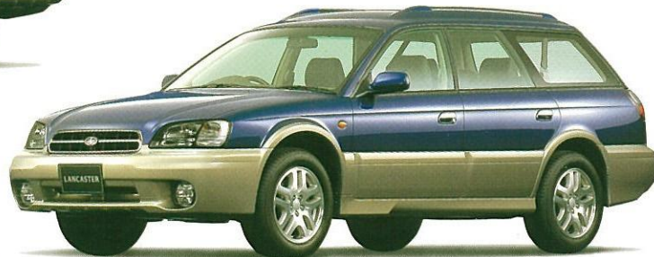
バイオレットブルー・マイカ/ストームグレー・オパール 2トーン (ADA車を除く) フッ素樹脂クリア塗装もメーカー装着オプション(受注生産)でご用意しております。