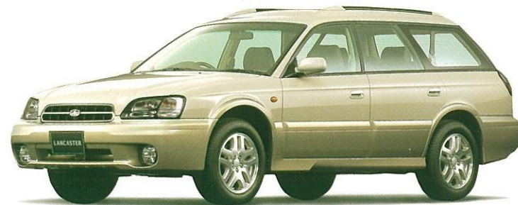
ソリッドグレー/ストームグレー・オパール 2トーン フッ素樹脂クリア塗装もメーカー装着オプション(受注生産)でご用意しております。