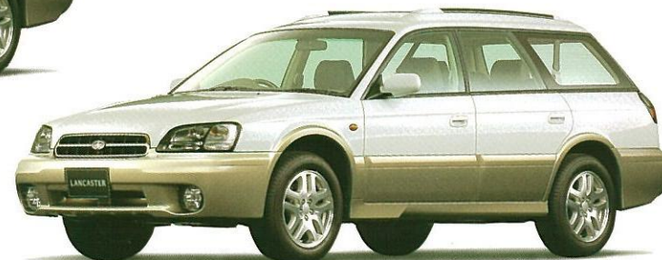
ピュアホワイト/ストームグレー・オパール 2トーン (受注生産) (ADA車を除く) フッ素樹脂クリア塗装もメーカー装着オプション(受注生産)でご用意しております。