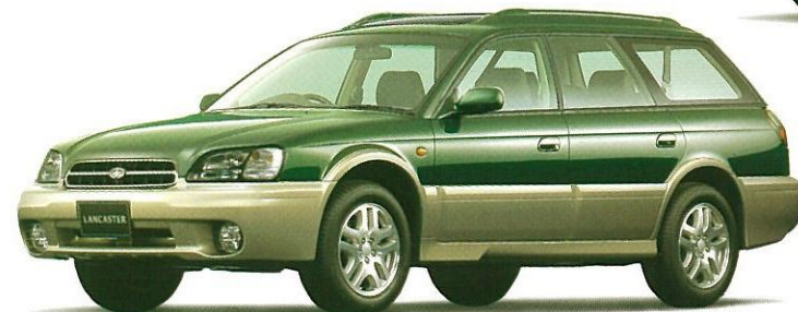
ハンターグリーン・マイカ/ストームグレー・オパール 2トーン (ADA車を除く) タンデムサンルーフはメーカー装着オプション