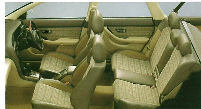
シート地: チェックファブリック/プロテインレザー&スエードトリコット 内装色: ブラウン/ベージュ 2トーン