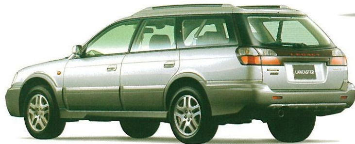
アーキティクシルバー・メタリック/グレー・オパール 2トーン ADA車にはフッ素樹脂クリア塗装もメーカー装着オプション(受注生産)でご用意しております。