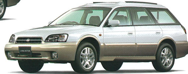
ビュアホワイト/ストームグレー・オパール 2トーン(受注生産)(ADA車を除く) フッ素樹脂クリア塗装もメーカー装着オプション(受注生産)でご用意しております。