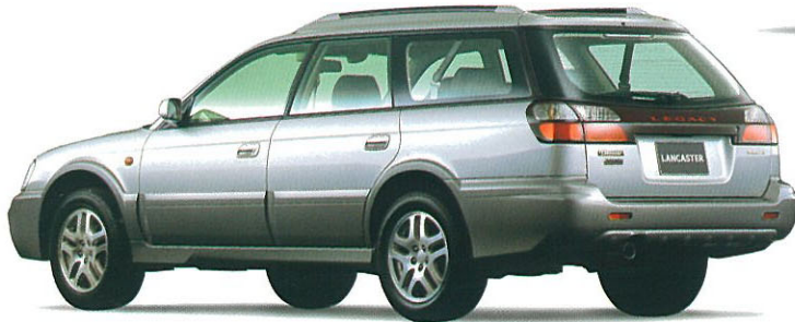
アークティックシルバー・メタリック/グレー・オパール 2トーン Photo:ランカスター-ADA ADA車にはフッ素樹脂クリア塗装もメーカー装着オプション(受注生産)でご用意しております。