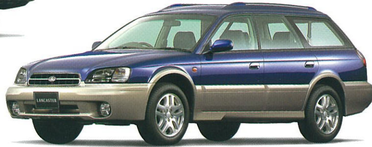
バイオレットブルー・マイカ/ストームグレー・オパール 2トーン(ADA車を除く) フッ素樹脂クリア塗装もメーカー装着オプション(受注生産)でご用意しております。