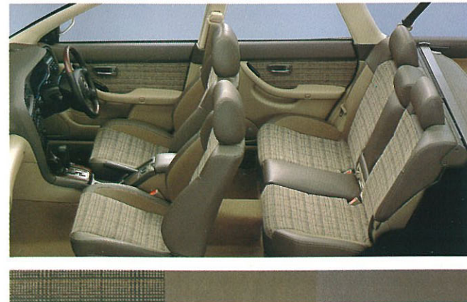
シート地:チェックファブリック/プロテインレザー&スエードトリコット 内装色:ブラウン/ベージュ 2トーン