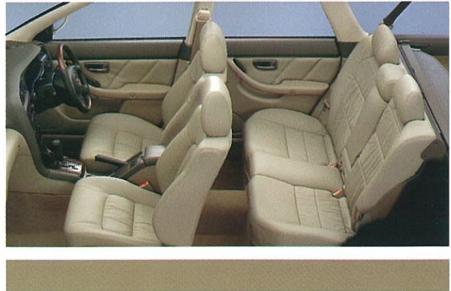
シート地:本革・ベージュ(メーカー装着オプション・受注生産) 内装色:ブラウン/ベージュ 2トーン