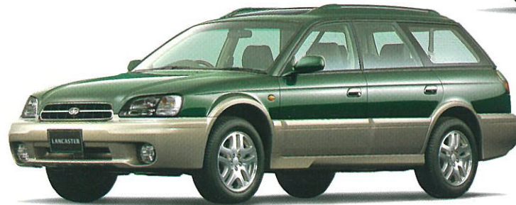
ハンターグリーン・マイカ/ストームグレー・オパール 2トーン(ADA車を除く) タンデムサンルーフはメーカー装着オプション