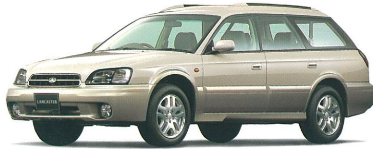
ソリッドグレー/ストームグレー・オパール 2トーン フッ素樹脂クリア塗装もメーカー装着オプション(受注生産)でご用意しております。