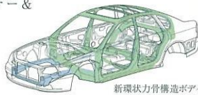
新環状力骨構造ボディ

水平対向エンジン縦置きSUBARU 4WDは、バンパーまでストレートに伸びるフロントサイドフレームが優れた衝撃吸収能力を発揮。衝突時にはエンジンがフロアトンネルに沿って後退、乗員や相手へのダメージをやわらげます。さらに全方位で高い衝突安全性能を持つ新環状力骨構造ボディをベースに、デュアルSRSエアバッグ、プリテンショナー & ロードリミッター付フロント3点式ELRシートベルト、リヤ全席3点式ELRシートベルト & シートビローを採用しました。