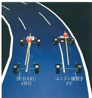
低重心かつ重量バランスのよいSUBARU 4WD

水平対向エンジン (BOXER) と左右対称レイアウトの4WDシステムを組み合わせた独自のメカニズム「SUBARU 4WD」は、優れた運動バランスを実現。街中ではもとよりハイウェイ、ワインディングなどあらゆる道でスポーティ&コントロールな走りが愉しめます。