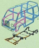
シャーシフレーム付 新環境力骨構造

スバル独自の安全ボディに、運転席SRSエアバッグと衝撃吸収ハンドル。後席3点式ELRシートベルトはチャイルドシートにも対応。デュアルSRSエアバッグ&ABSもオプション設定。みんなが安心してドライブできます。