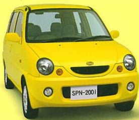
チェイスイエロー