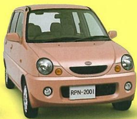
クラシックローズ・メタリック