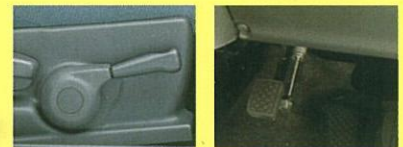
運転席シートリフター