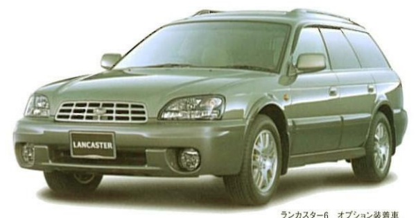
ランカスター-6 オプション装着車 レガシイ ランカスターのアクセサリ(ディーラー装着オプション)は、このほかにも豊富に用意しています。詳しくは「アクセサリカタログ」をご覧ください。