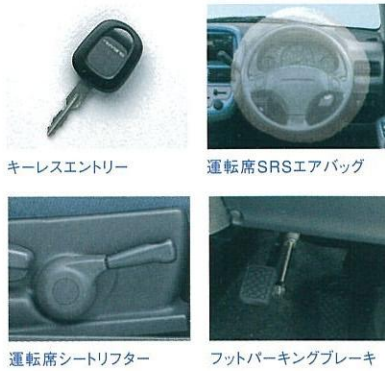
キーレスエントリー 運転席SRSエアバッグ 運転席シートリフター フットパーキングブレーキ