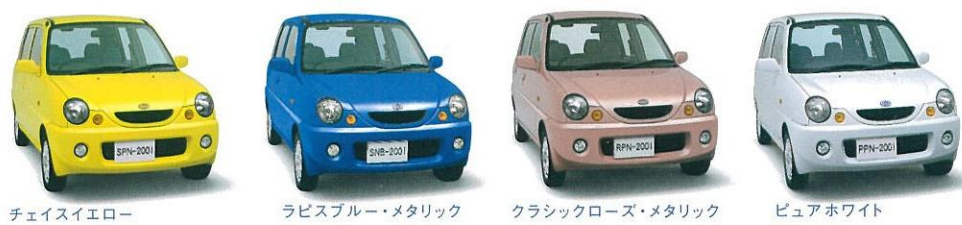
チェイスイエロー ラビスブルー・メタリック クラシックローズ・メタリック ピュアホワイト