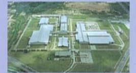
GMタイランド工場 GMの世界戦略に沿って、東南アジア、日本、欧州などへの輸出をカバーする最新鋭の自動車工場。トラヴィックにおいては、「世界でもっとも品質に厳しい」日本の品質基準に照らし合わせた、精度の高い生産システムを採用しています。