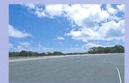
GMアジアパシフィック・エンジニアリング(テストコース) 最良の足回りを求め、奇麗なテストを繰り返し実施。類まれな走りを楽しめるのはここぞが磨かれました。