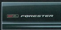
ブラック・マイカ