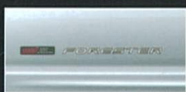
プレミアムシルバー・メタリック