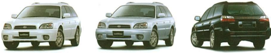
★ビュアホワイト ★プレミアムシルバー・メタリック ★ブラックパズ・マイカ

■この仕様は振替りく変更する場合があります。■写真は印刷の性質上、実際の色とは異なって見えることがあります。■実際の走行にあたっては、取扱説明書をよくお読みください。