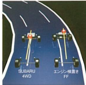
低重心かつ重量バランスのよいSUBARU 4WDはニュートラルなステアリング特性を実現

縦置きに搭載したBOXERエンジンと左右対称レイアウトの4WDシステムを組み合わせた「SUBARU 4WD」。前後左右の優れた重量バランスは、素直なハンドリングと、シャープな回頭性をもたらします。そしてSUBARUらしい運動性能の高さは、ドライバーズカーとしての大きなアドバンテージとなっています。