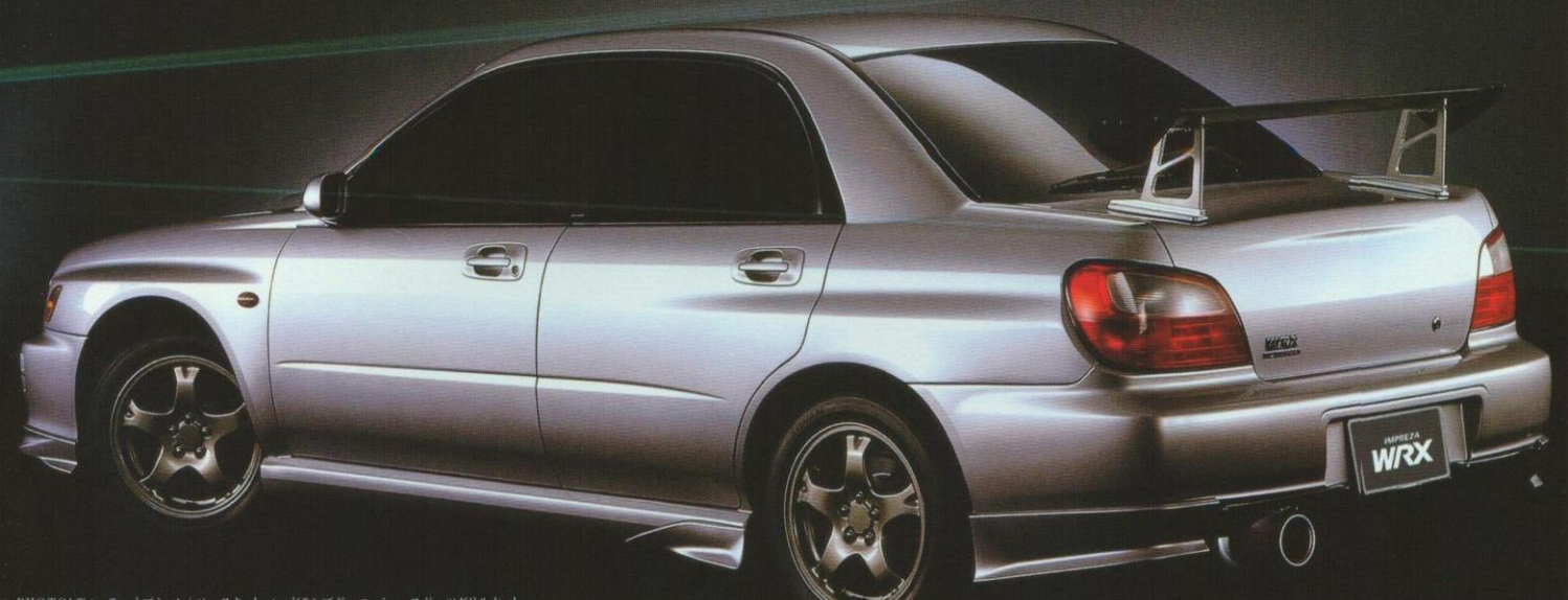
PHOTO:デイトナオプション(ベースキット、ヘッドランプガーニッシュ、スポーツグリルセット、フロントアンダースポイラー、リキアンダースポイラー、サイドストレーキ、トランクスポイラー、ドアミラーフィニッシャー、STI Genomeスポーツマフラー、大径フォグラブ・マルチコーティングタイプ)を装着しています。