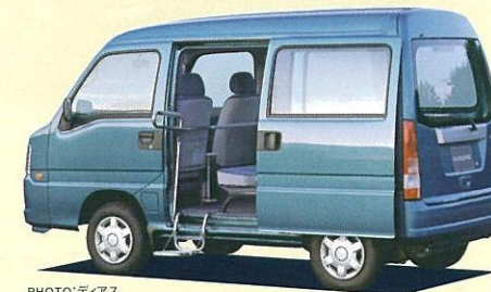
ウイングステップ わずかな段差に配慮した、手すり・ステップ付。足の不自由な方だけでなく、お年寄り、小さなお子様にも安心してお使い頂けます。

架装メーカー 桐生工業株式会社 群馬県桐生市相生町2-704 (〒376-0011) TEL 0277-52-8804