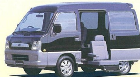
ウイングシートリフトタイプ 座ったまま乗り降り可能な、ウイングシート。足の不自由な方だけでなく、お年寄りの方にも使いやすいクルマです。

●仕様は改良のため予告なく変更することがあります。 ●トランスケアには、税制度、貸付・助成などさまざまな優遇措置が用意されています。