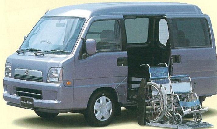
電動リフター 車いすをプラットフォームに載せ、スイッチひとつで昇降・収納の操作が可能。また、後座アームレストも装備し、介護する方にとっても快適な電動リフターです。

サンバートランスケアシリーズは、自動操作が可能な介護装置など、介護する方にとっても使いやすい介護福祉車両です。4名乗車や広い室内など、サンバーならではの快適仕様が、より一層、過ごしやすい快適な室内空間をつくりだしています。