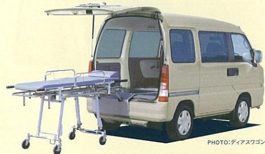
ストレッチャー 寝たままスムーズに乗降ができる、1.8mの本格ストレッチャーを装備。広さと信頼の造りで、大切な人を支えます。