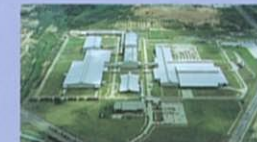
GMタイランド工場 GMの世界戦略に沿って、東南アジア、日本、欧州などへの輸出をカバーする最新鋭の自動車工場。トラヴィックにおいては、「世界でもっとも品質に厳しい」日本の品質基準に照らし合わせた、精度の高い生産システムを採用しています。