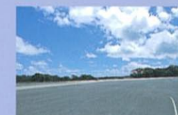
GMアジアパシフィック・エンジニアリング(テストコース) 最良の足回りを求め、苛酷なテストを繰り返し実施。類まれな走りを楽しめる心地はここで磨かれました。