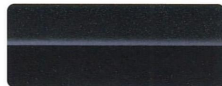
ブラックパールズ・メタリック