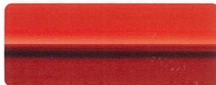
プレミアムレッド (3万円高)