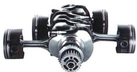
写真左上:フロント対向4ポットブレーキキャリパー (赤色塗装・SUBARUロゴ入り) 右上:アルミバッド付スポーフペダル 左下:フロント・ヘリカルLSD (MT車) 右下:フロント・ストラットタワーバー (Blitzen専用)

走ることをクルマの本質と考えるSUBARUが磨き上げた「水平対向エンジン+シムトリー4WD」。その、低重心かつ優れた重量バランスがもたらす高次元の走りを、心ゆくまで愉しんでいただくために。2003 modelでは、Blitzenが従来から装備してきたフロント・ストラットタワーバー、フロント・ヘリカルLSD (MT車)と併せ、MT車のみだったフロント対向4ポットブレーキキャリパーをAT車へも展開。さらにステアリングギヤレシオを変更し、よりニアでスポーティなステアリング特性を獲得した。ドライバーの意思とずれることなく、走り・曲がり・止まる喜び。エモーショナルな存在であり続けるために、Blitzenは進化を遂げる。