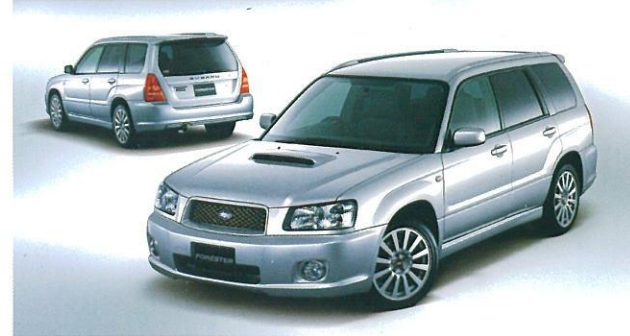
PHOTO:プレミアムシルバー・メタリック スポーティパッケージ、クリアビューパック、17インチBBS製アルミホイール+タイヤセットはメーカー装着オプション 2.0 BOXER DOHC 16VALVE AVCS TURBO(スポーツシートE-4AT/5MT) 162kW(220PS)/5500rpm 309N・m(31.5kg・m)/3500rpm 全国メーカー希望小売価格 AWD 5MT 233.7万円●メーカー装着オプションは含まれません。●AT車は249.5万円 詳しくは「フォレスターカタログ」をご覧ください。