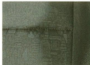
ヴィジュアルディデラックス (ブラック・ファブリック) (SLパッケージ®) ※SLパッケージはボディカラー ③⑤⑥ 選択時