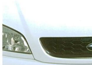
①カサブランカホワイト