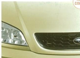
⑧アイボリーゴールド・メタリック【受注生産】