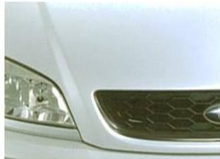
②スターシルバー・メタリックⅢ