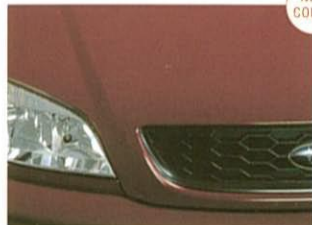
⑤ルビーレッド・マイカ