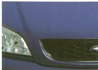
④ポーラーシブルー・メタリック