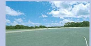
GMアジアパシフィック・エンジニアリング (テストコース)

GMの世界戦略に沿って、東南アジア、日本、欧州などへの輸出をカバーする最新鋭の自動車工場。トラヴィックにおいては、「世界でもっとも品質に厳しい」日本の品質基準に照らし合わせた、精度の高い生産システムを採用しています。