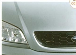
⑦グレイスチール・メタリック【受注生産】