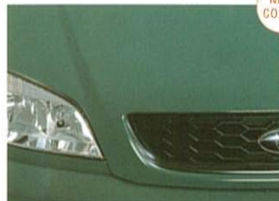
⑨ジェイドグリーン・マイカ【受注生産】