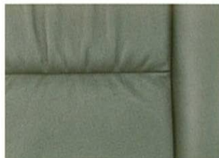
シュアプリームパッファローゼー (ブラック・本革) (SLパッケージにメーカー装着オプション)