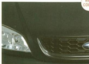
⑥サファイアブラック・マイカ