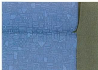
ヴィジュアルディデラックス (ブルー・ファブリック) (SLパッケージ®) ※ボディカラー ①②④⑥⑦⑧ 選択時