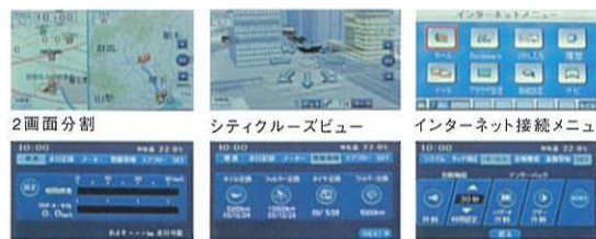
燃費計 メンテナンス情報 キーレス機能設定

従来のナビゲーション機能に加えて、新たに車内LANと連携し、瞬間燃費やメンテナンス更新時期など車両情報をリアルタイムで表示する、「マルチインフォメーション機能」を搭載。さらにアンサーバック、ルームランプ、盗難警報装置などの機能設定を変更できる「カスタマイズ機能」も採用。ドライブを快適にサポートします。