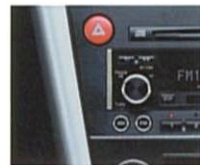
オフブラック内装のパネルサイドは本アルミとなります。

高音質なサウンドを車内空間に響かせる。それはB4が奏でるプレミアムスポーツの愉しみにふさわしいパフォーマンスのひとつでもあります。だからこそB4は、歪みのないクリアな音質にこだわったMcIntosh社プレミアムオーディオを、その進化とともに一新。フロントスピーカーは、高音域用のツイーターや低音域用のウーファーのほか、中音域専用のスクーアーを装着した3way方式。ツイーターには広い指向性をもつダブルツイーターを採用。さらにリヤ部には迫力の重低音を再現する大口径スーパーウーファーを装着するなど、計13個のスピーカーを配備。またボディ側に専用の防振材を配置し、入念なチューニングを施しました。歪みを低減するパワーガード回路を搭載した150Wパワーアンプとともに、よりクリアで緻密なサウンドを実現します。さらにヘッドユニットはCD-R/RW対応のインダッシュ6連奏CDチェンジャー、MDプレーヤー、AM/FMチューナーを一体化。エアコンパネル、シフトノブとともにブラックで統一するなど、音質・機能・外観すべてに本格派ホームオーディオを彷彿とさせる。こだわりを徹底。B4でのドライブをどこまでも豊かなものにします。メーカー装着オプション