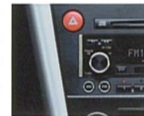
オフブラック内装のパネルサイドは本アルミとなります。

高音質なサウンドを車内空間に響かせる。それはB4が奏でるプレミアムスポーツの愉しみにふさわしいパフォーマンスのひとつでもあります。だからこそB4は、歪みのないクリアな音質にこだわったMcIntosh社プレミアムオーディオを、その進化とともに一新。フロントスピーカーは、高音域用のツイーターや低音域用のウーファーのほか、中音域専用のスクーカーを装着した3way方式。ツイーターには広い指向性をもつダブルツイーターを採用。さらにリヤ部には迫力の重低音を再現する大口径スーパーウーファーを装着するなど、計13個のスピーカーを配備。またボディ側に専用の防振材を配置し、入念なチューニングを施しました。歪みを低減するパワーガード回路を搭載した150Wパワーアンプとともに、よりクリアで緻密なサウンドを実現します。さらにヘッドユニットはCD-R/RW対応のインダッシュ6連奏CDチェンジャー、MDプレーヤー、AM/FMチューナーを一体化。エアコンパネル、シフトノブとともにブラックで統一するなど、音質・機能・外観すべてに本格派ホームオーディオを彷彿とさせる。こだわりを徹底。B4でのドライブングをどこまでも豊かなものにします。メーカー装着オプション