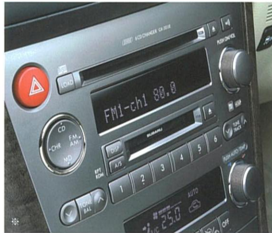
※写真はアイボリーレーザーセレクション装着車。(メーカー装着オプション) アイボリーレーザーセレクションのパネルサイドはメープル調となります。