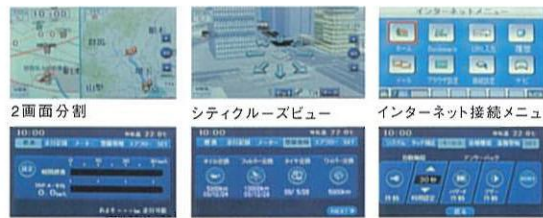
燃費計 メンテナンス情報 キーレス機能設定

従来のナビゲーション機能に加えて、新たに車内LANと連携し、瞬間燃費やメンテナンス更新時期など車両情報をリアルタイムで表示する、「マルチインフォメーション機能」を搭載。さらにアンサーバック、ルームランプ、盗難警報装置などの機能設定を変更できる「カスタマイズ機能」も採用。ドライブングを快適にサポートします。