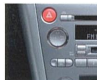
オフブラック内装のパネルサイドはメタル調となります。

MDプレーヤー (MD-LP対応)、インダッシュ6連奏CDチェンジャー (CD-R/RW対応)、AM/FMチューナーなど、各コントロールユニットをエアコンパネルと一体化。メタル調の同色系で美しくインテグレートされた高機能オーディオ。さらにB4の音場特性にあわせてFIXイコライザー、前後6スピーカーを専用チューニング。140Wのハイパワー＆ハイクオリティサウンドが楽しめます。