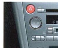
オフブラック内装のパネルサイドはメタル調となります。