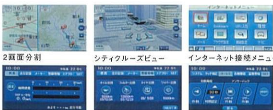
2画面分割 シティクルーズビュー インターネット接続メニュー 燃費計 メンテナンス情報 キーレス機能設定

従来のナビゲーション機能に加えて、新たに車内LANと連携し、瞬間燃費やメンテナンス更新時期など車両情報をリアルタイムで表示する、「マルチインフォメーション機能」を搭載。さらにアンサーバック、ルームランプ、盗難警報装置などの機能設定を変更できる「カスタマイズ機能」も採用。ドライブを快適にサポートします。