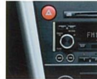
オフブラック内装のパネルサイドは本アルミとなります。

高音質なサウンドを車内空間に響かせる。それはレガシィが奏でるグランドツーリングの愉しみにふさわしいパフォーマンスのひとつでもあります。だからこそレガシィは、歪みのないクリアな音質にこだわったMcIntosh社プレミアムオーディオを、その進化とともに一新。フロントスピーカーは、高音域用のツイーターや低音域用のウーファーのほか、中音域専用のスクーナーを装着した3way方式。ツイーターには広い指向性をもつダブルツイーターを採用。さらにリヤ部には迫力の重低音を再現する大口径スーパースピーカーを装着するなど、計13個のスピーカーを配備。またボディ側に専用の防振材を配置し、入念なチューニングを施しました。歪みを低減するパワーガード回路を搭載した150Wパワーアンプとともに、よりクリアで緻密なサウンドを実現します。さらにヘッドユニットはCD-R/RW対応のインダッシュ6連奏CDチェンジャー、MDプレーヤー、AM/FMチューナーを一体化。エアコンパネル、シフトノブとともにブラックで統一するなど、音質・機能・外観すべてに本格派ホームオーディオを彷彿とさせる、こだわりの徹底。レガシィでのドライビングをどこまでも豊かなものにします。3.0Rにメーカー装着オプション