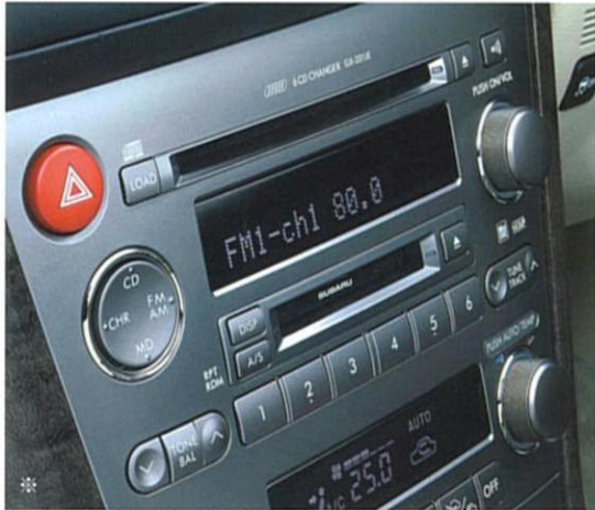
※写真はアイボリーレーザーセレクション装着車。(メーカー装着オプション) アイボリーレーザーセレクションのパネルサイドはメープル調となります。