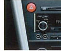
オフブラック内装のパネルサイドは本アルミとなります。

MDプレーヤー（MD-LP対応）、インダッシュ6連奏CDチェンジャー（CD-R/RW対応）、AM/FMチューナーなど、各コントロールユニットをエアコンパネルと一体化。メタル調の同色系で美しくインテグレートされた高機能オーディオ。さらにレガシィの音場特性にあわせてFIXイコライザー、前後6スピーカーを専用チューニング。140Wのハイパワー&ハイクオリティサウンドが愉しめます。