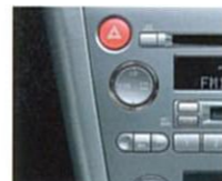
オフブラック内装のパネルサイドはメタル調となります。

MDプレーヤー (MD-LP対応)、インダッシュ6連奏CDチェンジャー (CD-R/RW対応)、AM/FMチューナーなど、各コントロールユニットをエアコンパネルと一体化。メタル調の同系色で美しくインテグレートされた高機能オーディオ。さらにレガシィの音場特性にあわせてFIXイコライザー、前後6スピーカーを専用チューニング。140Wのハイパワー&ハイクオリティサウンドが愉しめます。