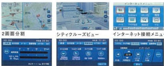
燃費計 メンテナンス情報 キーレス機能設定

従来のナビゲーション機能に加えて、新たに車内LANと連携し、瞬間燃費やメンテナンス更新時期など車両情報をリアルタイムで表示する、「マルチインフォメーション機能」を搭載。さらにアンサーバック、ルームランプ、盗難警報装置などの機能設定を変更できる「カスタマイズ機能」も採用。ドライビングを快適にサポートします。