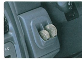
コインホルダー (5MT車)