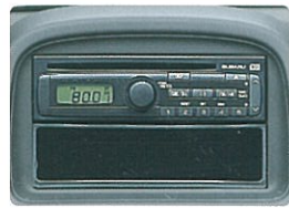
CDプレーヤー & AM/FMチューナー [2スピーカー] (F typeS)