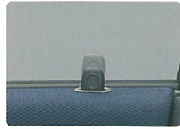
集中ドアロック (F typeSに標準装備。 F, Aにメーカー装着オプション)