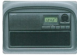
時計機能付AMチューナー [スピーカー内蔵] (A)