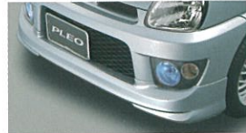
フロントバンパースカート