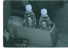
フロアコンソール (2カップホルダー)