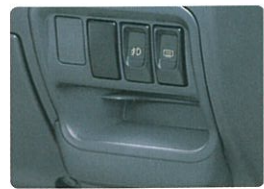
インパネルポケット (カードホルダー付)