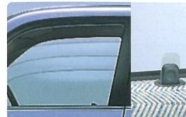
パワーウィンドウ+集中ドアロック (リヤゲート運動)+ 赤外線リモコンドアロック (キー一体式)