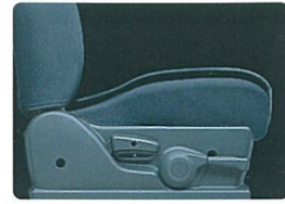
レバー式運転席シートリフター (F typeS)