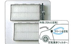
ビルトイン空気清浄フィルター