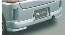
リヤバンパースカート