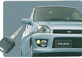
アンサーバック機能付電波式リモコンドアロック (F typeS)