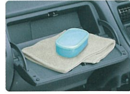
インパネルマルチボックス