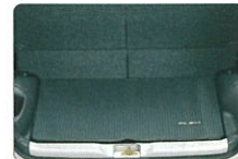
リヤラゲジマット