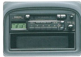
カセットデッキ & AM/FMチューナー [2スピーカー] (F)