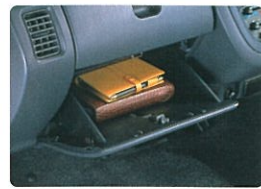
グローブボックス