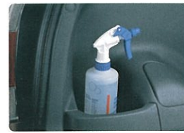
ラゲジールームサイドポケット