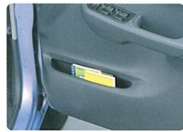
フロントドアポケット