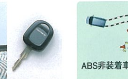
EBD付4センサー4チャンネルABS+ 155/65R13タイヤ (フルホイールキャップ付)