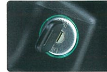
イグニッションキー照明