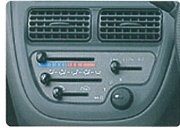
マニュアルエアコン (エコモード付)