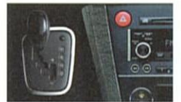
ブラックセンターパネル＋メープル調パネルサイド＋ブラックタイプセレクトレバー