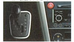
ブラックセンターパネル＋アルミ調パネルサイド＋ブラックタイプセレクトレバー