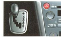
メタル調センターパネル＋アルミ調パネルサイド＋アルミ調セレクトレバー