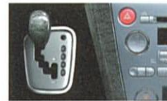
メタル調センターパネル＋メープル調パネルサイド＋メープル調セレクトレバー