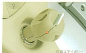
ディフューザーセット(アイボリー/オフブラック) 付属のパッドに香りを一滴たらし、 インパネアクセサリソケットに装着すると、 熱の力で車内にすてきな香りが広がります。

清流に吹く風のような爽やかな香りが、ドライブをより気持ちよくします。爽快な気分で行きたいときなどにオススメ。オレンジや、涼しげなナルシスのフローラルをバランスよくブレンドしています。