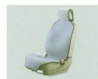
リバーシブルエプロン

雨の日も、レジャーでも、 汚れても安心。 サーフ& スノーキット= リバーシブルエプロン(2脚)+ ラゲッジトレイ