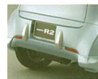
リヤバンパープロテクター

全身コーディネートで 安心&おしゃれを。 プロテクターキット= フロントバンパープロテクター+ リヤバンパープロテクター+ ドアアンダープロテクター