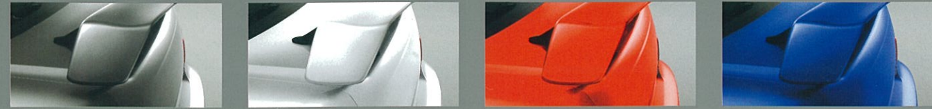
クリスタルグレー・メタリック ビュアホワイト ソリッドレッド WRブルー・マイカ