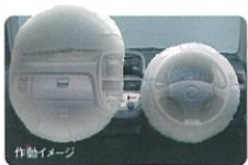
デュアルSRS ※2 エアバッグ (助手席SRSエアバッグはメーカー装着オプション) ※2 SRS=Supplemental Restraint System (補助拘束装置)

【アンチロック・ブレーキシステム】やデュアルSRS ※2 エアバッグもメーカー装着オプションをご用意しています。