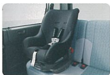
ISO FIX ※1 チャイルドシート対応構造&テザーアンカー ※1 ISO FIX=ISO (国際標準化機構) が定めた認定方式

簡単な操作で、確実に装着できるISO FIX ※1 チャイルドシート対応構造&テザーアンカーと、万一の衝突の際に、頼りになる運転席SRS ※2 エアバッグ。さらにボディ全体であなたを守る「新環状力骨構造ボディ」を採用。万一の際の安全性をめざしています。また、ABS