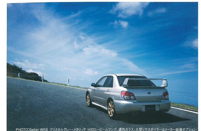
PHOTO: Sedan WRX クリスタルグレー・メタリック HIDロビームランプ、濃色ガラス、大型リヤスポイラーはメーカー装着オプション

走りの愉しさと、環境性能をひとつに。 人とクルマの幸せな関係が、いつまでも続くために、私たちSUBARUは環境問題へ積極的に取り組んでいます。燃費性能や排出ガスの低減を目指し、軽量化や省エネルギーのエンジンなど効率の良いパフォーマンスを追求。さらに、リサイクル率の向上や自動車生産における環境負荷低減といった、生産から廃棄に至るすべてのプロセスで、環境に配慮したクルマづくりを行っています。