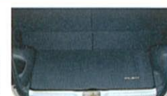
リヤラゲジマット