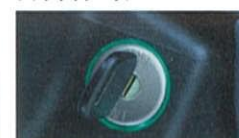
イグニッションキー照明

*1:L typeS、L、F typeSはアンサーバック機能付電波式リモコンドアロックとなります。