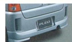
リヤバンパースカート