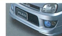
フロントバンパースカート