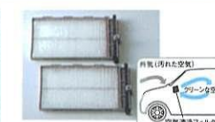
ビルトイン空気清浄フィルター