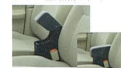
アームレストコンソール