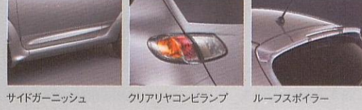
PHOTO: R ルーフスポイラー、Bピラーガーニッシュ、クリアリアコンビランプ、サイドガーニッシュ、リヤバンパーコート、マフラーカッター、ベースキット装着車

R1のアクセサリ(ディーラー装着オプション)はこの他にも豊富にご用意しております。詳しくは「アクセサリカタログ」をご覧ください。 http://accessory.subaru.co.jp