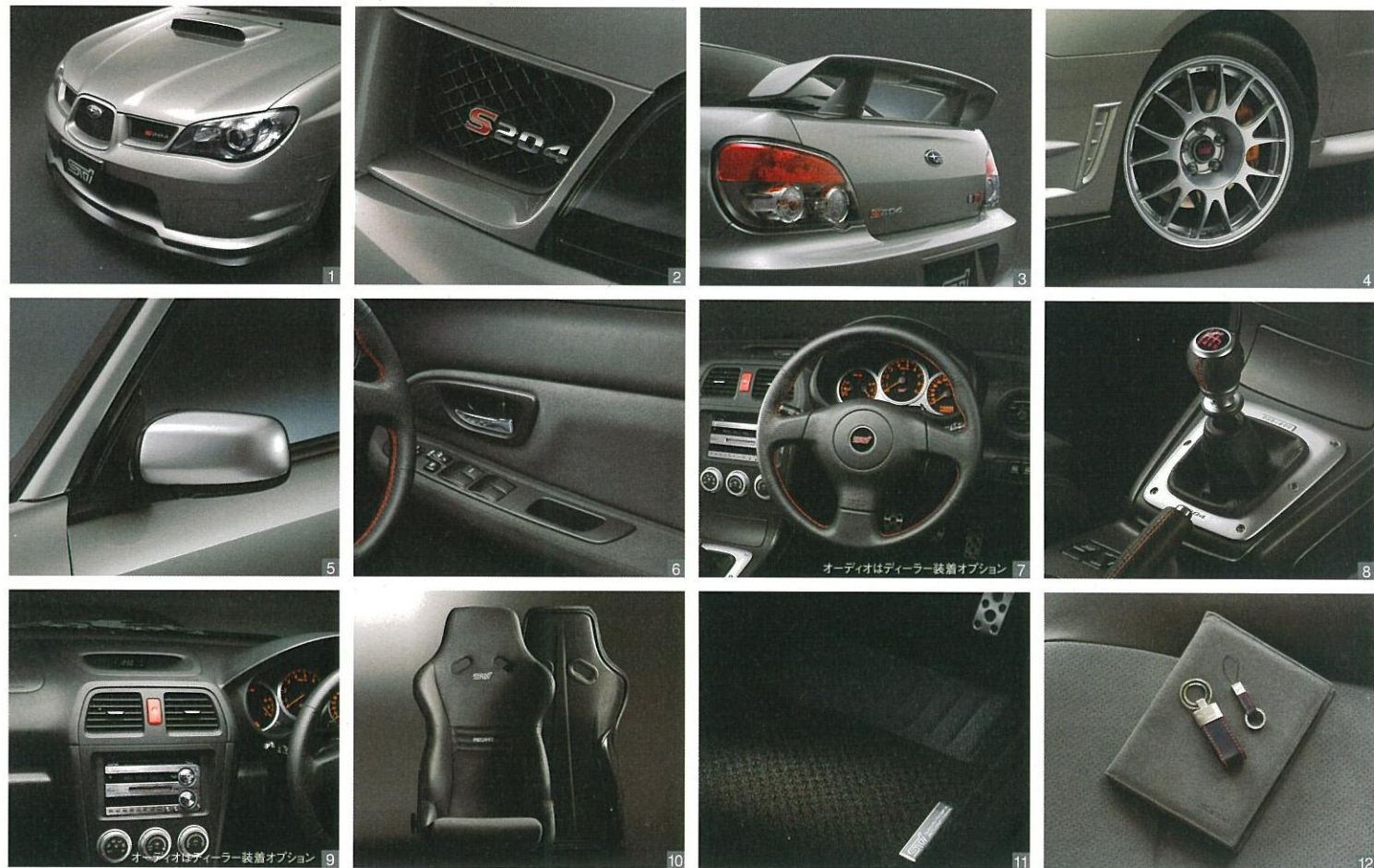
主要専用装備 ■専用ドライカーボン製フロントアンダースカート(スカートリップ付)■専用シルバーマッシュフロントグリル■専用リヤウイングスポイラー(ハイマウントストップランプ付)■専用BBS製鍛造アルミホイール 18×8.5J(ダイヤモンドシルバークリア塗装) ■電動格納式専用メタル調リモコンドアミラー■専用ドアトリム材質 アルカンターラ(ダークグレー)■専用本革巻ステアリングホイール(STIチェリーレッドステッチ付)■専用オーナメント■専用本革巻MTシフトノブ(チェリーレッドシフトパターン&STIチェリーレッドステッチ付) ■専用塗装インパネ(アッパー部)■専用ドライカーボン製シェル リクライニング機構付フロントバケットシート■専用カーペットマット(STIオーナメント&強化パッド付)■専用S204シリアルナンバー入りキーホルダー&専用アルカンターラ車検証入れ *STI,RECARO共同開発