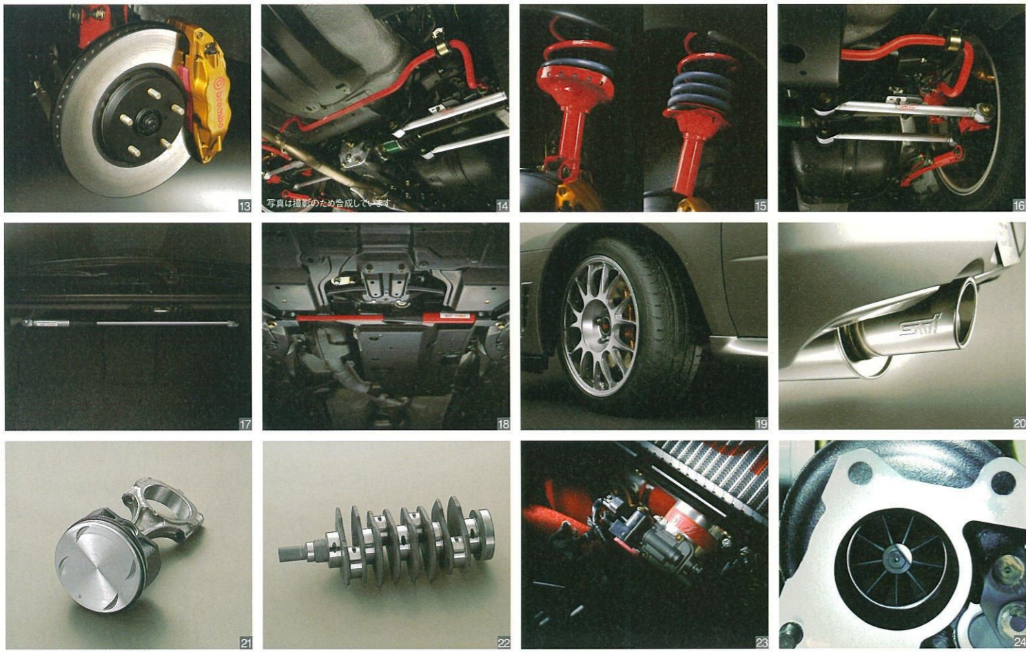
主要専用装備 専用アウトワーベンチレーテッドディスクブレーキローター&スポーツブレーキパッド専用φ21リヤスタビライザー専用チューニング倒立4輪ストラット専用ピロボールブッシュ付アルミ製リヤラテラルリンク(前側&後側)&ピロボールブッシュ付リヤトレーリングリンク専用リヤパフォーマンスダンパー*専用フロントパフォーマンスダンパー*専用ビレリ製 P ZERO CORSA System 235/40ZR18タイヤ専用低背圧チタン製スポーツマフラー(φ110) 専用バランス調整済コンロッド&ピストン専用バランス調整済クランクシャフト強化シリコンゴム製エアインテークダクト&強化シリコンゴム製エアダクトホース専用大型ツインスクロールターボ(ボールベアリング) *STI、ヤマハ発動機(株)共同開発