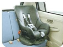
ISO FIXチャイルドシート対応構成