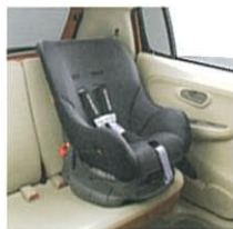
ISO FIXチャイルドシート対応構造