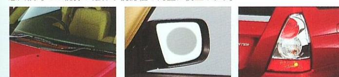
フロントワイパーデアイサー

フロントワイパーデアイサー、ヒータードリアミラー、リヤフォグランプの組み合わせ。悪天候時での視界の確保や視認性の向上に役立ちます。