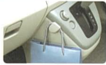
フロントコンビニフック (助手席)