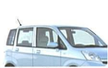
UVカットガラス(フロントドア、リヤドア、リヤクォーターリヤゲート) ※フロントガラスもUVカット機能があります。