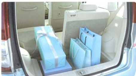
5:5分割可倒式リヤシート