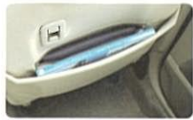
運転席シートバック ダブルポケット (インナーはファスナー付車検証入れ)