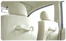
後席らく乗りグリップ(左右)