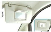
運転席バニティミラー & チケットホルダー