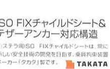
※ステラ用ISO FIXチャイルドシートは、厳に新しい安全技術の開発を旨とする、車内拘束装置メーカー「TAKATA」製です。