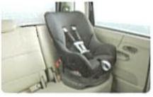
ISO FIXチャイルドシート& テザーアンカー対応構造