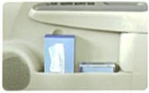
フロント大型ドアポケット (ティッシュボックスホルダー付)