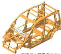
新環状力骨構造ボディ

ステラは、SUBARU独自の「新環状力骨構造ボディ」を採用。あらゆる衝突形態に対して、優れた衝突安全性能を発揮することをめざしています。さらにフレームレイアウトを工夫することで、自車よりも重い乗用車と衝突した際に効果的に衝撃を吸収できるよう考慮しています。また、簡単に装着できるISO FIXチャイルドシートにも対応しています。