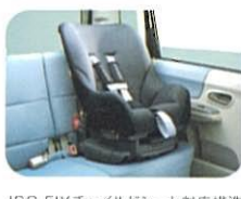
ISO FIXチャイルドシート対応構造 ※ステアリング、ISOチャイルドシートは、常に正しい安全姿勢の取扱いを必ず守り、車両取扱説明書(メーカー)をご覧ください。TAKATA