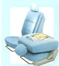
助手席マルチユーティリティシート (水平可倒機構)

運転席からワンタッチで助手席を倒して、テーブルとしても使えるので、場面に合わせたさまざまな使い方が可能です。